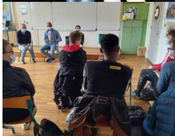
26 mars 2021 représentation au lycée des métiers du bâtiment à Felletin

Mahmoud et Nini c'est la rencontre entre un jeune égyptien homosexuel de confession musulmane et une française athée d'âge mûr venant du fin fond de la Lorraine. Ils sont en train de se rencontrer alors que tout semble les opposer. Ils ne parlent pas la même langue, ils n'ont pas le même genre, ils ne partagent pas les mêmes croyances, mais ils sont tous les deux acteurs ! Ce qui les réunit, c'est le théâtre. L'espace scénique, par sa neutralité, vient rassembler et unifier les divergences. Il est le témoin du choc des cultures et le lieu où les stéréotypes explosent.