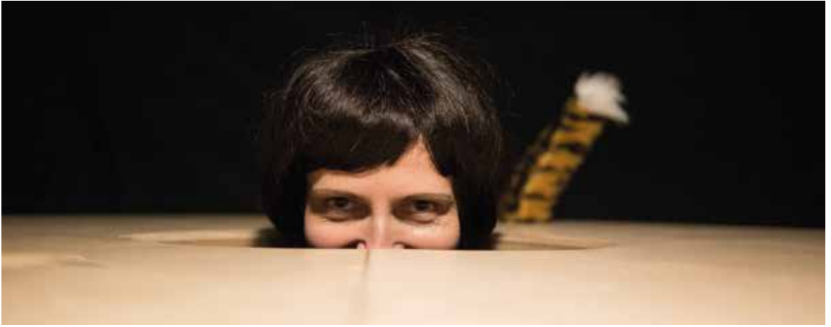
Spectacle Down Tiger Down - cf page 15