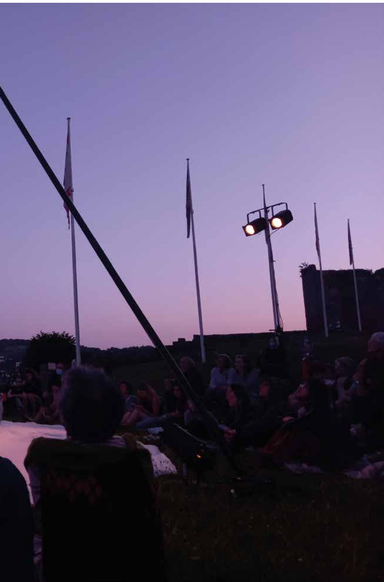
18 Juillet 2021 à la colline du Chapitre Aubusson : Hêtre de la Cie Libertivore . Spectacles à venir en mai cf. P. 5