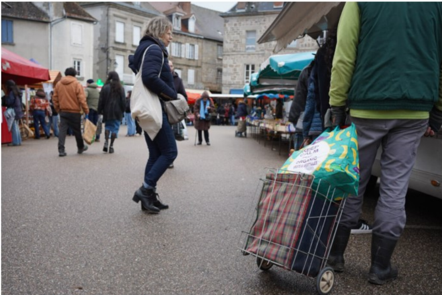
Au marché de Felletin, le vendredi matin.

C'est à ce sujet que l'équipe municipale sortante a consacré le plus gros investissement de son mandat : la construction d'une maison de santé, dont le chantier va démarrer au printemps. L'installation d'un médecin et d'un infirmier-kinésithérapeute est déjà annoncée, et l'on espère, à la mairie, que cela va faire boule de neige.