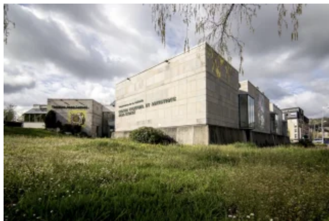
Centre culturel et artistique Jean-Lurçat -

Le ministère de la Culture s'est engagé à financer 50 % du montant des travaux. Cette participation exceptionnelle s'explique sans doute par des enjeux d'équité territoriale, les moyens étant plus limités ici, mais aussi par la présence d'une Scène nationale dans ce bâtiment. La Région Nouvelle-Aquitaine, dans le cadre du contrat de plan État Région, s'engage à hauteur de 20 %. Une dotation spécifique de l'État assure environ 10 %. Le Département devait, quant à lui, se charger des 20 % restants, la loi imposant au propriétaire de participer a minima à cette hauteur.