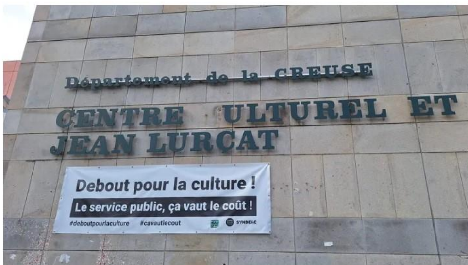
Un collectif citoyen organise une première réunion d'échange autour de l'avenir du Centre culturel et artistique Jean-Lurcat d'Aubusson, dimanche 1 er février 2026.

Pour la directrice de la Scène nationale, l'implication des usagers dans la sauvegarde de ce lieu emblématique a de quoi redonner de l'espoir. "C'est enthousiasmant de voir que les habitants font valoir leurs idées, leurs envies. Ils connaissent ce centre culturel depuis 45 ans pour certains et ils ont bien envie que leurs enfants et leurs petits enfants puissent en bénéficier ensuite" , développe Christine Malard.