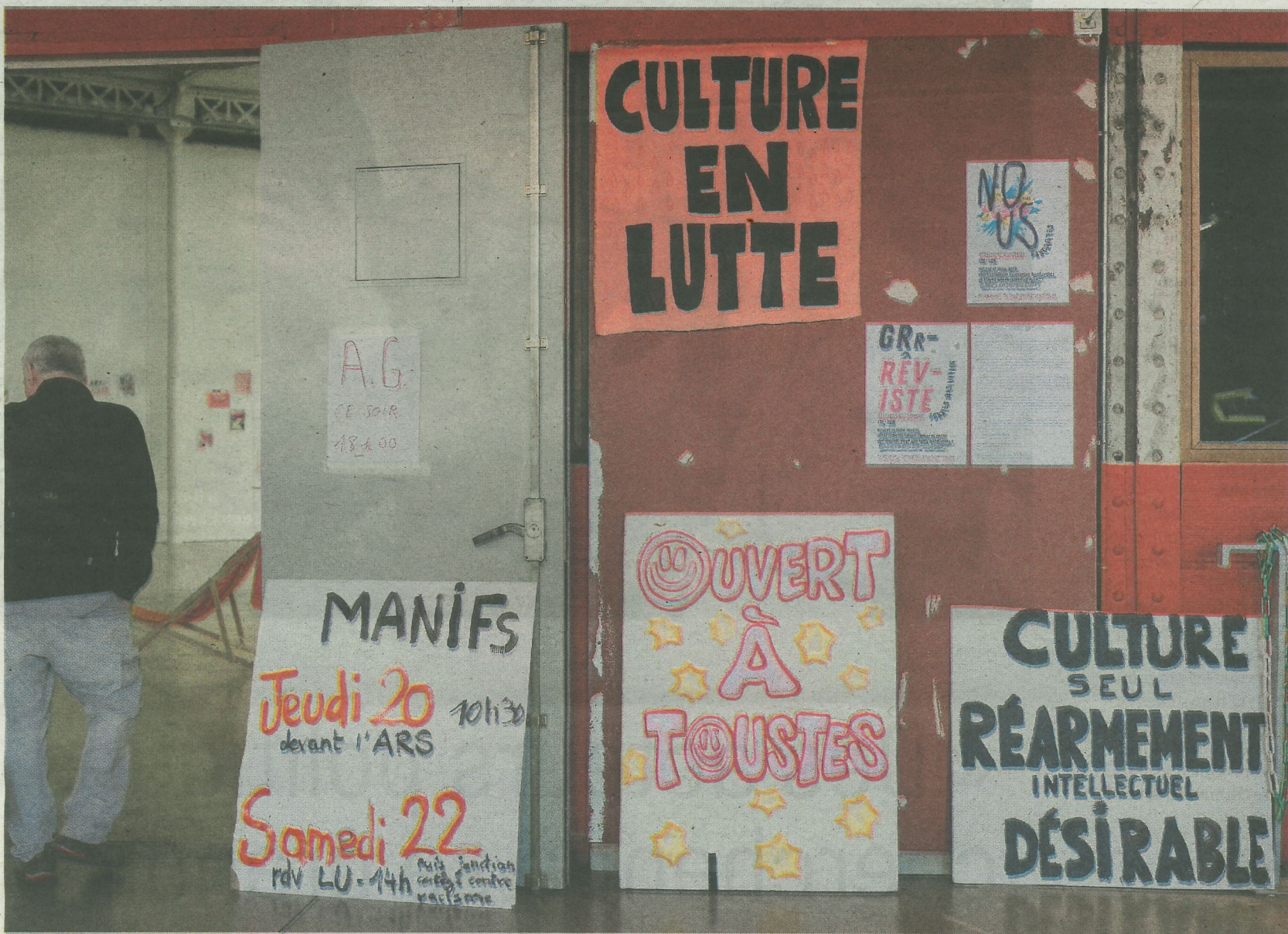
Lors de la mobilisation au Lieu unique, à Nantes, en mars 2025, pour dénoncer les importantes coupes budgétaires des subventions publiques pour la culture de la région Pays de la Loire.

les spectateurs se sont organisés dans un collectif d'usagers du centre culturel (qui comprend le théâtre, la médiathèque et les classes théâtre) et préparent un événement le 1 er février prochain.