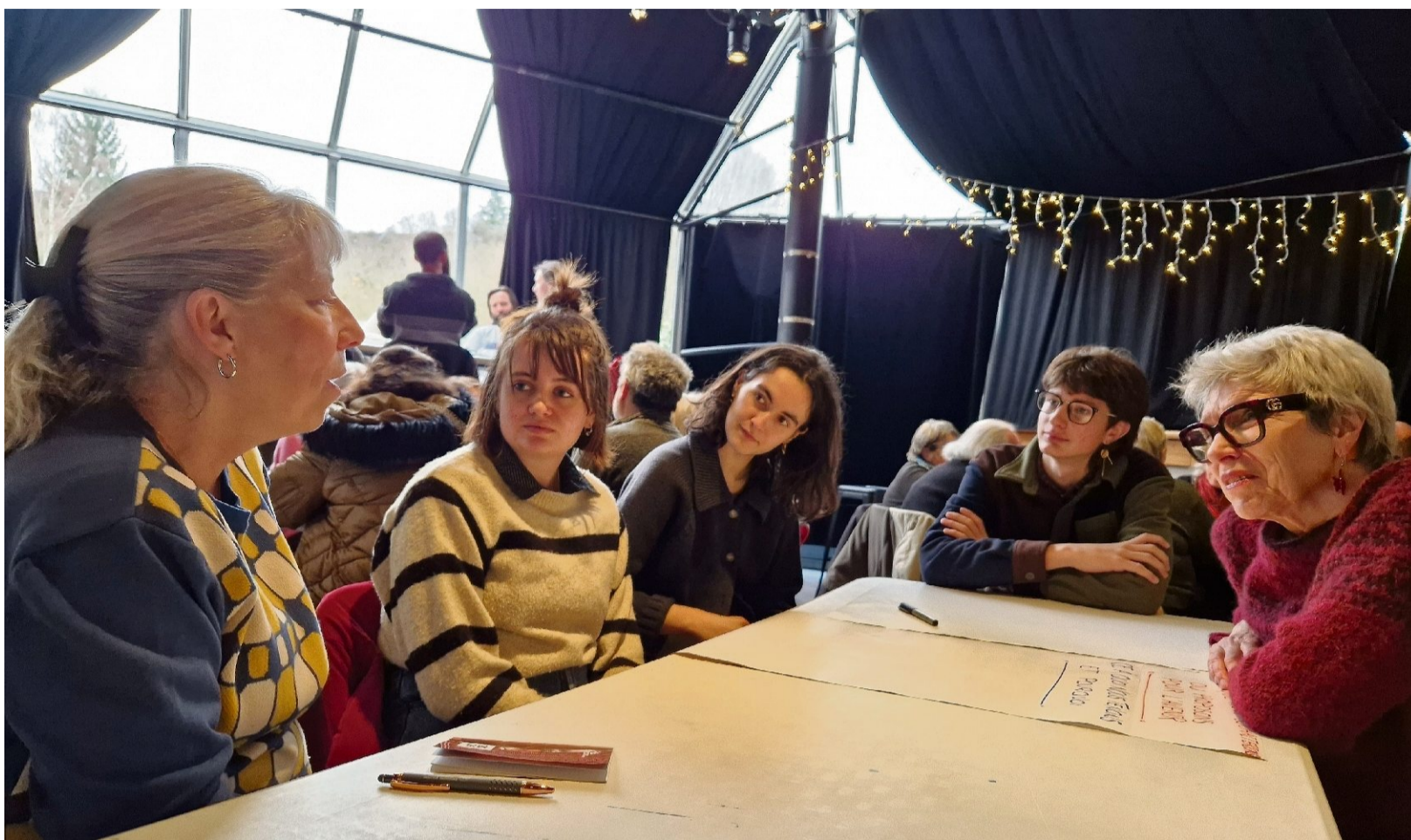
Au travers d'ateliers participatifs, les usagers ont planché sur l'avenir du site, hier, à Aubusson.