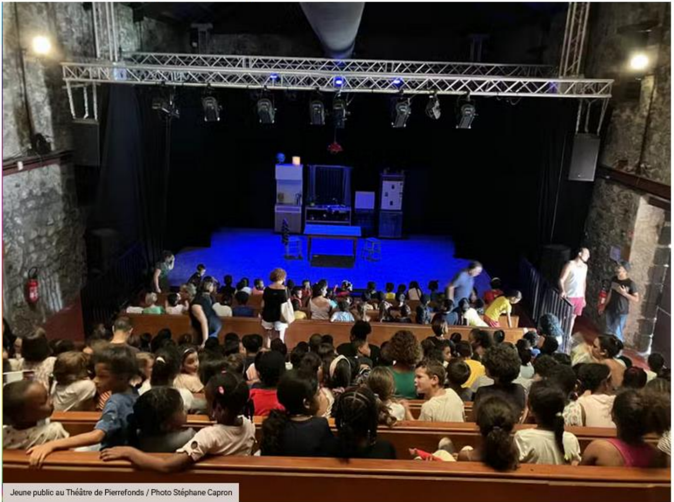
Jeune public au Théâtre de Pierrefonds

Alors que les professionnels du spectacle vivant se réunissent cette semaine aux Biennales Internationales du Spectacle (BIS) à Nantes , tous les voyants sont au rouge. Baisse des subventions des collectivités locales, sous-financement du FONPEPS, arrêt de compagnies, menaces de fermetures de théâtre : l'année 2026 s'annonce morose. Pour certaines organisations syndicales, c'est « un plan social massif » qui menace la profession.