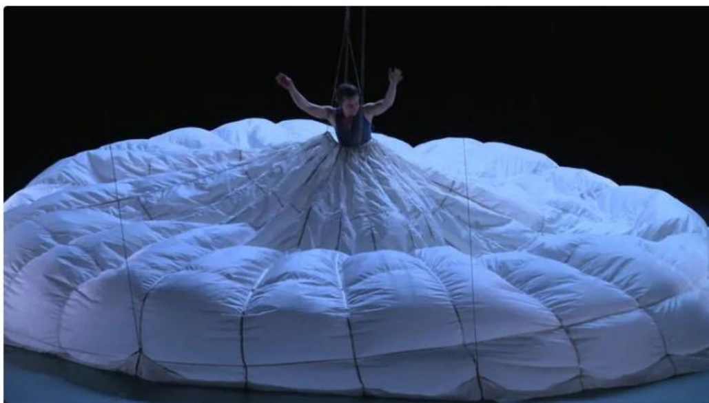
La compagnie indépendante de danse et de cirque Libertivore travaille depuis plusieurs années en partenariat avec la scène nationale Jean-Lurçat.

Cette compagnie indépendante de danse et de cirque collabore depuis plusieurs années avec la scène nationale Jean-Lurçat. Les artistes peuvent ainsi venir régulièrement et mener des projets sur du long terme avec les habitants. "On crée du lien. Aujourd'hui, la représentation était complète. Les gens sont ravis qu'il se passe des choses sur leur territoire. C'est important, il faut vraiment que cela continue d'exister" , insiste Pauline Barboux.