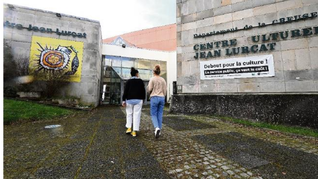
La Scène nationale, acteur incontournable dans le sud de la Creuse.

Ce dernier plaide pour un rapprochement rapide des différents partenaires : « Il convient de mettre tout le monde autour de la table et de s'inscrire dans un projet de rénovation sur plusieurs années car le problème qu'ont les EPCI, ce n'est pas de penser investissement mais fonctionnement. Il faut absolument ouvrir le dialogue, martèle-t-il. On comprend la situation du Département compte tenu du contexte budgétaire, mais maintenant il faut organiser la discussion. Il faut que l'État nous accompagne sur ce point-là car on arrive au bout de quelque chose