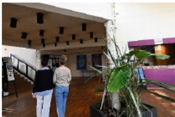
Le conseil d'administration appelle à l'organisation.

Centre culturel et artistique d'Aubusson. Un collectif des usagers vient d'être créé. L'avenir du théâtre Jean Lurçat - Scène nationale d'Aubusson est menacé le risque étant réel qu'il se retrouve sans lieux pour la rentrée. En décembre 2025, le conseil départemental a voté une autorisation d'occupation temporaire qui permet au théâtre d'utiliser le centre culturel artistique dont l'échéance est fixée au 5 juillet 2026. Afin que le théâtre puisse continuer à remplir du label Scène nationale, le Conseil d'administration de la Scène nationale « appelle à l'organisation urgente d'une réunion de concertation réunissant le Département, la Région, la communauté de communes, la commune d'Aubusson et l'État. » Objectif : « Construire collectivement des perspectives durables et partagées ». Le collectif des usagers du CCAJL vient d'être créé pour faire valoir leurs droits à des services publics artistiques et culturels.