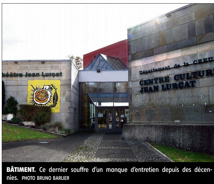
BÂTIMENT. Ce dernier souffre d'un manque d'entretien depuis des décennies.