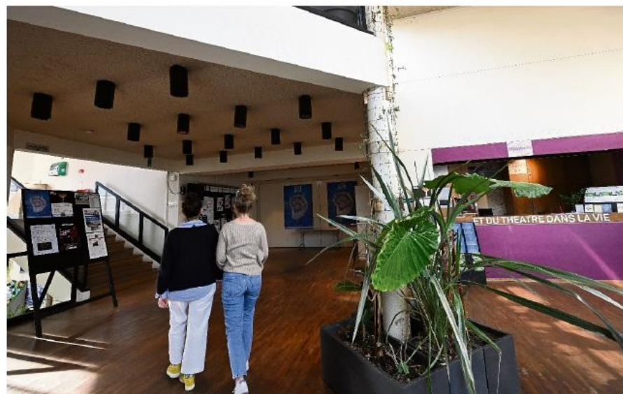
Les membres du collectif veulent témoigner leur attachement au centre culturel.

sans le musée de la tapisserie déménagé à la Cité de la tapisserie. Les membres du collectif restent bien sûr lucides, ils savent qu'ils ne vont pas régler le problème, mais espèrent à leur petit niveau faire office en quelque sorte de « catalyseur ». S'inscrire dans une démarche positive et constructive est leur seul credo. Misant sur du concret, ils ont décidé, ni une ni deux, d'organiser une première action ce dimanche 1 er février après-midi. Le but de la démarche est d'être force de proposition. L'idée est de mettre en place « des ateliers de réflexion et d'échanges sur le projet culturel de demain parce qu'aujourd'hui il manque un pied au projet initial, le musée, et du coup si on n'en trouve pas un second, on n'y arrivera pas ». Les habitants sont ainsi invités à participer massivement afin de dire ce qu'ils ont envie de voir dans ce lieu. Une après-midi qui fera l'objet d'une synthèse et qui sera communiquée aux élus, il ne s'agit